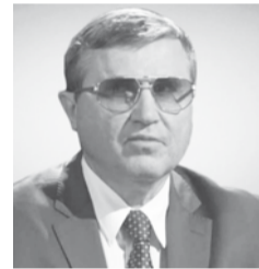
Депутат Госдумы фракции КПРФ О.Н. СМОЛИН о престиже профессии учителя: