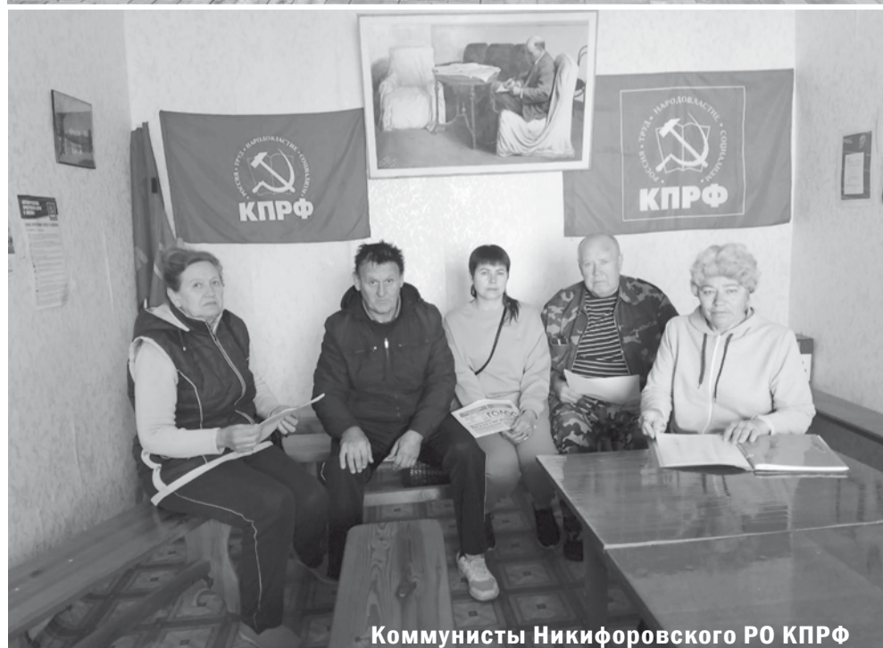
Коммунисты Никифоровского РО КПРФ

апрельском 1993 года Референдуме, о кровавых событиях в столице на первомайской демонстрации того же года и о так называемой амнистии в отношении всех участников событий 21 сентября – 4 октября 1993 года, узаконенной постановлением Госдумы в феврале 1994 года.