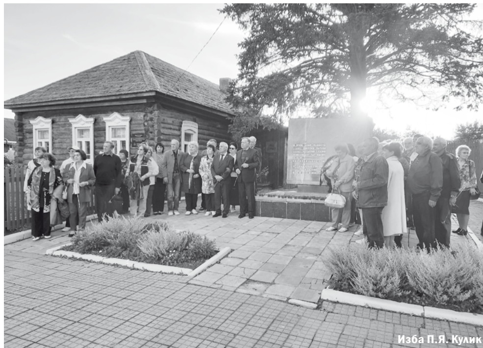
Изда П.Я. Кулик