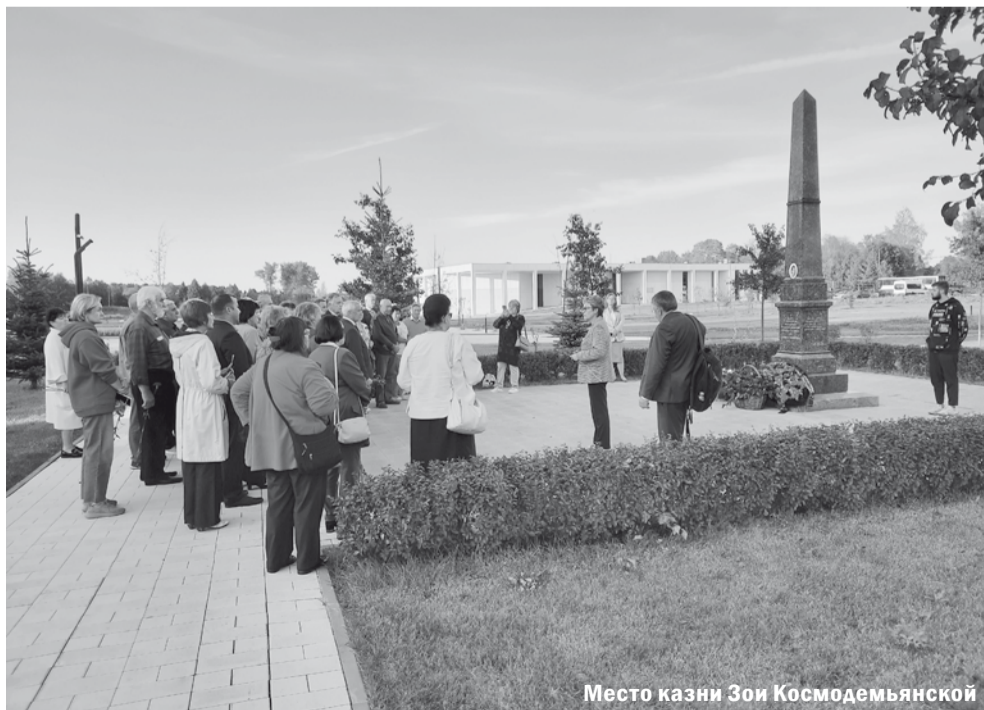
Место казни Зои Космодемьянской

О судьбе Зои Космодемьянской стало широко известно из статьи Петра Лидова, опубликованной в газете «Правда» 27 января 1942 года. Автор услышал