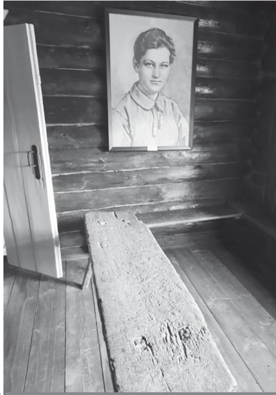
Скамья, на которой Зоя Космодемьянская провела последние часы жизни