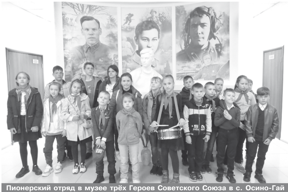
Пионерский отряд в музее трёх Героев Советского Союза в с. Осино-Гай