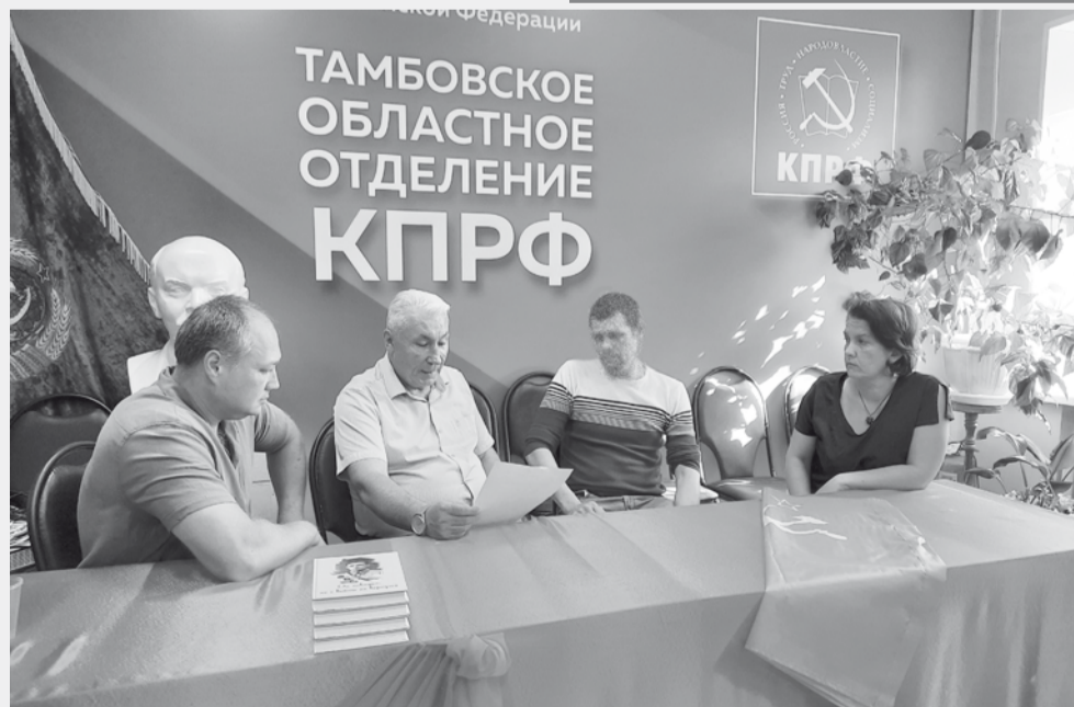
Подготовлено пресс-службой Тамбовского ОК КПРФ