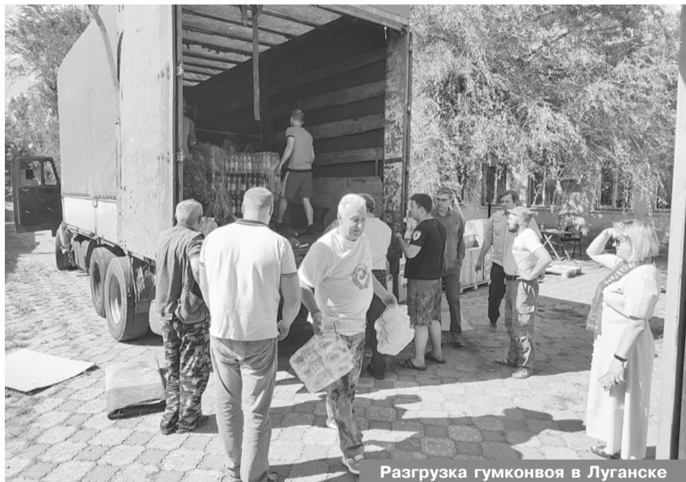
Разгрузка гумконвоя в Луганске

Во фракцию регулярно обращаются граждане, поэтому значительное место в работе депутатов от КПРФ отводится работе с письмами и обращениями. Круг вопросов широк. Среди них наиболее характерными являются проблемы, связанные с трудоустройством,