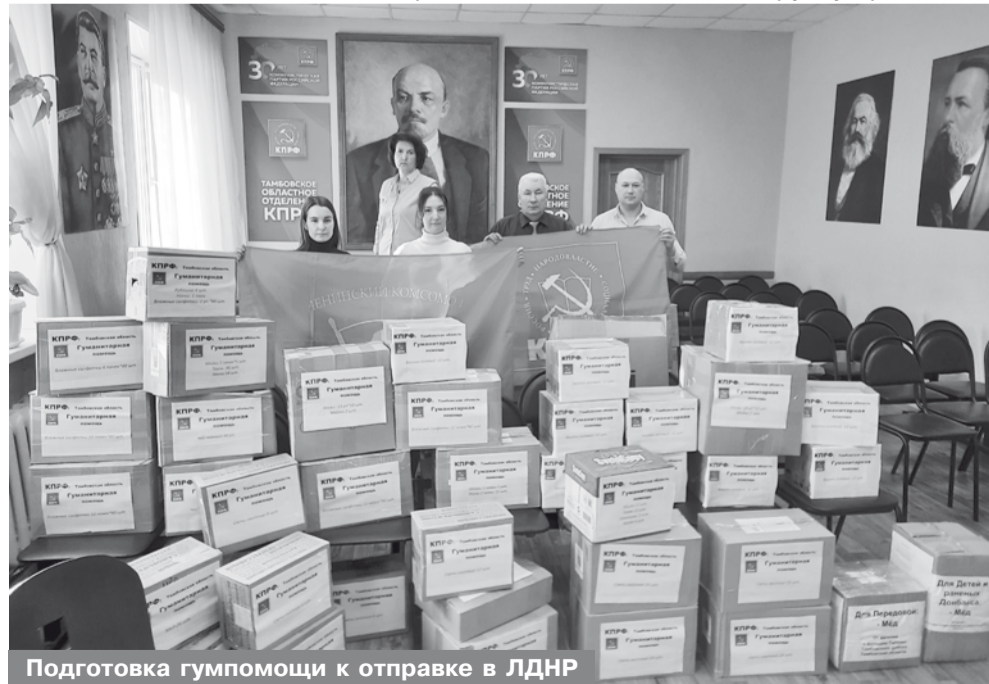
Подготовка гумпомощи к отправке в ЛДНР